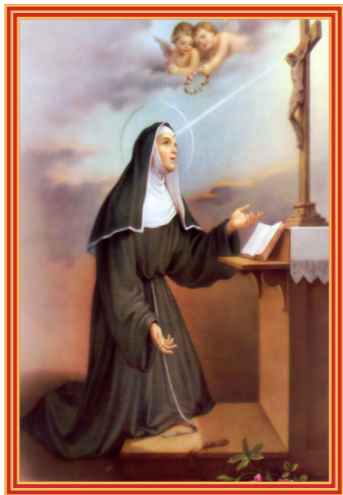
ՇՆՈՐՀԱԿԱԼ ԵՄ Արագահաս Սրբուհի Ռիթա